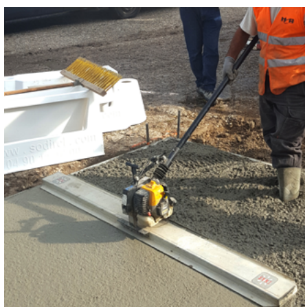
↑ Le béton pompé a été réparti et étalé manuellement, puis vibré à la règle vibrante pour assurer son bon serrage.