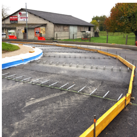
↑ Après l'homogénéisation de la fondation en GB, l'entreprise a procédé à l'installation des coffrages et des paniers de goujons, conformément au plan de calepinage.