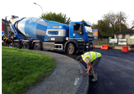
↑ Le giratoire a été doté de nouvelles bordures dont les fondations ont été renforcées pour éviter les retournements.