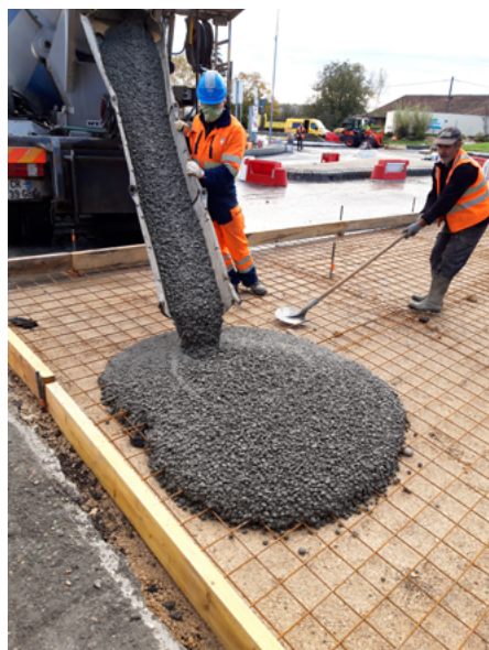
⤴ Réalisation des dalles de transition.

besoin d'utiliser du très gros matériel : la règle vibrante classique s'est révélée être une bonne méthodologie. Le savoir-faire de nos hommes a fait le reste. Le nivellement et la planéité ont été parfaitement assurés, l'écoulement des eaux s'effectuant sur les exutoires. »