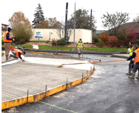
⤴ Le balayage, une étape cruciale pour obtenir une bonne PMT, gage d'adhérence sur le long terme pour les véhicules.