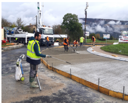
⤴ La protection du béton a été assurée par un produit de cure qui a été pulvérisé immédiatement après le traitement de surface.